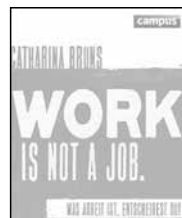
Work is not a job, Catharina Bruns, campus-Verlag, 2013