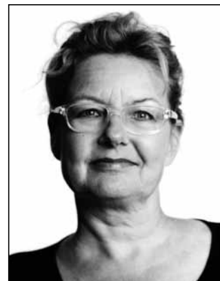
Dr. Maja Storch Motivationspsychologin und Buchautorin

Ja unbedingt. Im Bauchgefühl manifestiert sich das gesamte Lebensgefühl. Kluge Entscheidungen erfolgen nach bestem Wissen und im Einklang mit den Gefühlen. Wichtig ist eine realistische Einschätzung: Ich bin Experte, ich bin Greenhorn und brauche noch weitere Informationen von Experten.