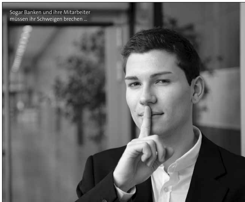
Sogar Banken und ihre Mitarbeiter müssen ihr Schweigen brechen ...