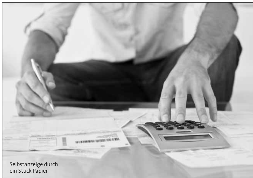
Selbstanzeige durch ein Stück Papier

Allerdings gibt es für den „Anzeiger“ seit 2010 eine wesentliche Erleichterung: Wenn der Täter die Umsatzsteuer im laufenden Jahr wissentlich nicht bezahlt hat oder zumindest bedingt vorsätzlich keine UVAs eingereicht hat, aber anschließend die korrekte Umsatzsteuerjahreserklärung unterschreibt, gilt er als „Anzeiger“. Für ihn erübrigt sich eine gesonderte Täternennung, die oft vergessen wurde. ●