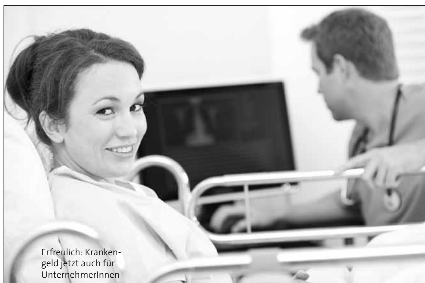
Erfreulich: Krankengeld jetzt auch für UnternehmerInnen

Die Unterstützungsleistung beträgt 26,97 € pro Tag, der Betrag wird jährlich valorisiert. Die Finanzierung erfolgt über die AUVA. Gleichzeitig bleibt die Möglichkeit der im GSVG verankerten Zusatzversicherung bestehen. ●